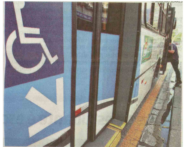
Nova legislação irá favorecer cerca de 30 mil passageiros de ônibus

A estimativa é de que aproximadamente 30 mil pessoas tenham alguma deficiência em Guarujá, o equivalente a 10% da população.